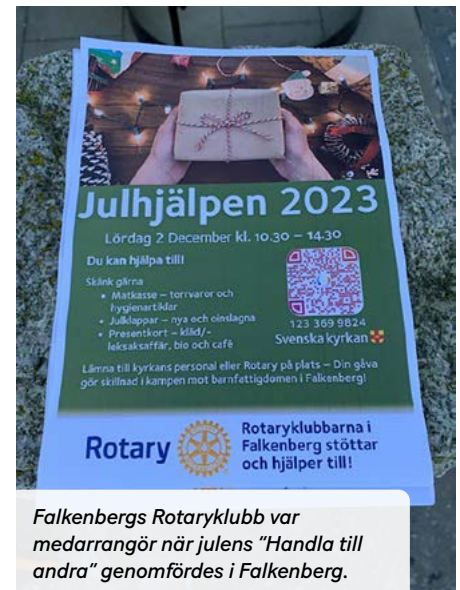
Falkenbergs Rotaryklubb var medarrangör när julens "Handla till andra" genomfördes i Falkenberg.

garnas stor vilja att hjälpa mindre lyckligt lottade bröder och systrar.