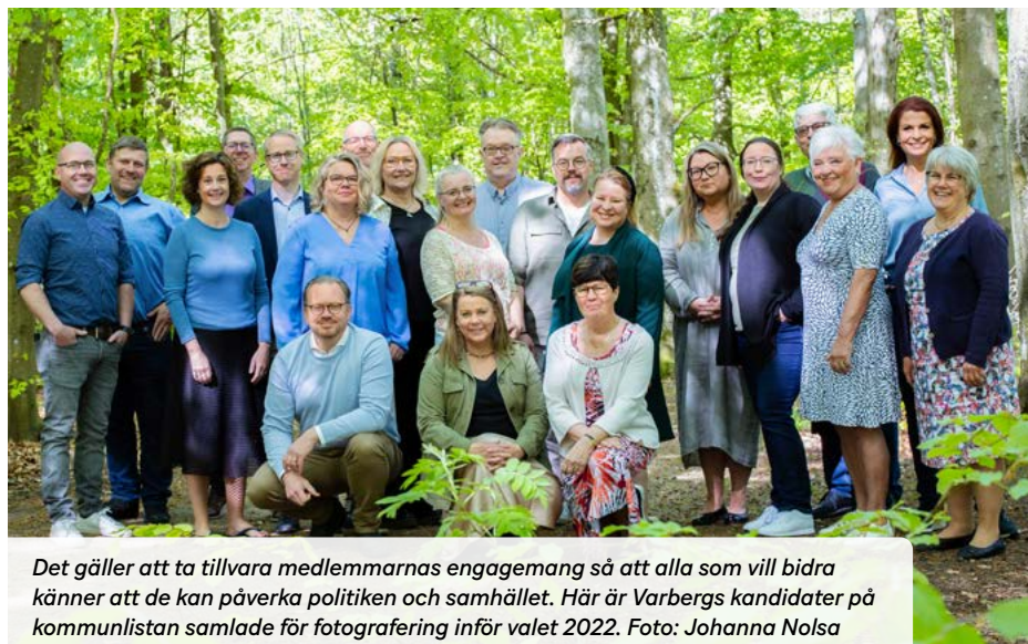
Det gäller att ta tillvara medlemmarnas engagemang så att alla som vill bidra känner att de kan påverka politiken och samhället. Här är Varbergs kandidater på kommunlistan samlade för fotografering inför valet 2022.

för energiproduktion i framtiden, och att vi är uppdaterade kring olika energialternativ. Det finns också tankar på att tillsätta fler arbetsgrupper framöver, med fokus på andra aktuella områden. Nu behöver vi saml